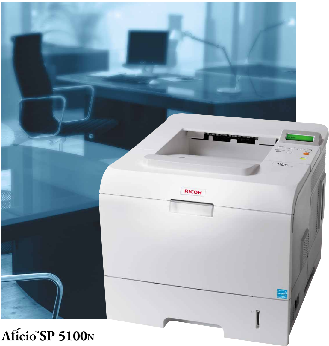
Aficio™ SP 5100N